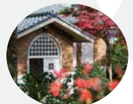
岩倉具視幽棲旧宅