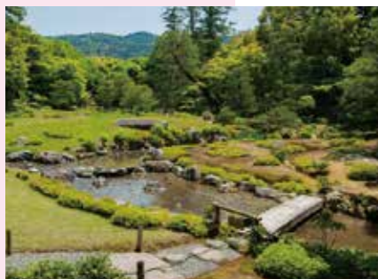
明治32年(1899) 大橋乙羽『名流談海』