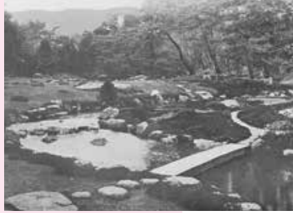
昭和10年(1935) 『ART OF THE LANDSCAPE GARDEN IN JAPAN』