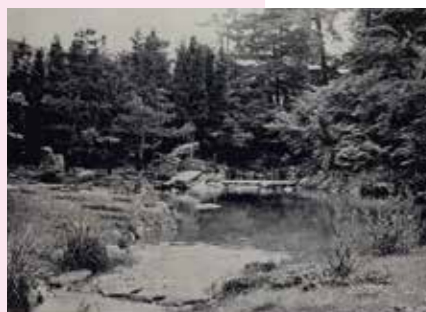
明治42年(1909) 京都府庁発行 湯本文彦『京華林泉帖』

池のふちに立つと、一番奥に滝が見えます。やっぱり滝は日本庭園の重要な要素です。現在は、庭園奥のスギの木は大きく成長しました。大きくなりすぎないように、時々切下げて今見ても美しく感じるようにしています。