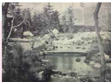
明治34年(1901) 『太陽』大橋乙羽撮影

4 一周して洋館の前に来ました。ここから北を見ると、なんと！明治の写真では電線が空を走っています。日本初の路面電車が無鄰菴のすぐ北を走っていました。そして外周のモミ木もまだ揃っていません。変化にとんだ明治時代に、ゆっくりと庭づくりを楽しんだ施主の心が伝わってくるような一枚です。