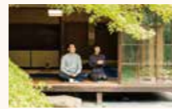
ウェブから事前購入が確定！

月1回、特別に茶室の中でカフェのメニューをお楽しみいただけます！日程はSNSでチェックを、よろしく！