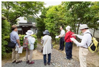
学芸員と史跡を歩く企画 * 写真は2019年度撮影